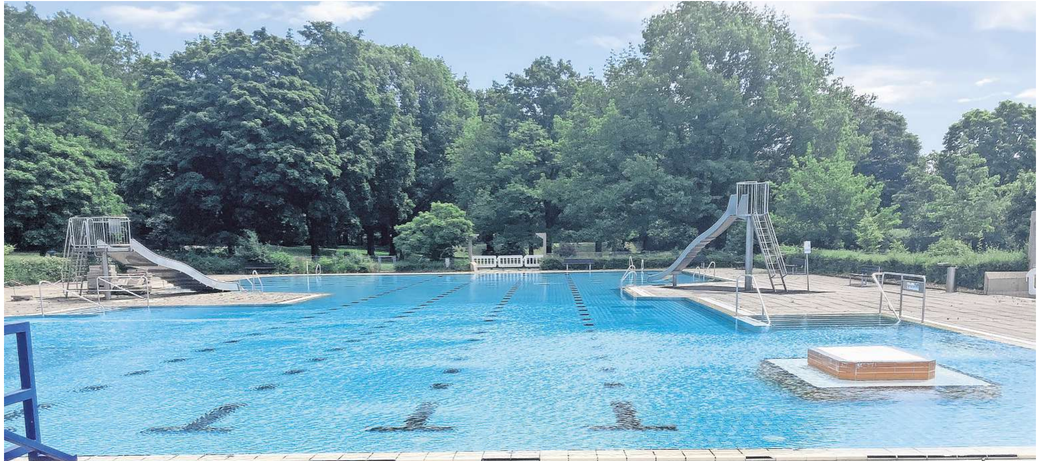
Gesperrt: Das Nichtschwimmerbecken im Lister Bad bleibt den gesamten Sommer über dicht – und soll dann erneuert werden.

Ursprünglich sollten Reparaturen und Erneuerungen im Lister Bad, im Hainhölzer Naturbad, im Volksbad Limmer und im Ricklinger Bad vertagt werden. Doch jetzt will die Stadt zumindest ihre Freibäder in Hainholz und in der List zeitnah sanieren. Der Grund: „Im neuen Haushalt für die Jahre 2025 und 2026 sind zusätzlich 11,5 Millionen Euro für Hanno-